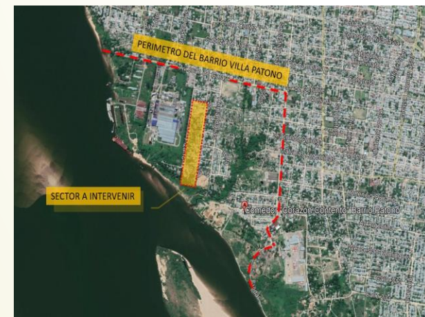
Imagen2- Foto aérea de ubicación Intervención en Barrio Villa Patono.