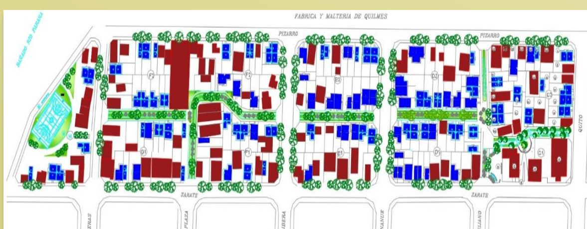
Imagen6- Plano de Propuesta de intervención. Reloteo, reubicación viviendas, viviendas existentes y unidades nuevas, equipamiento comunitario y recreativo, estructura circulatoria interna peatonal.