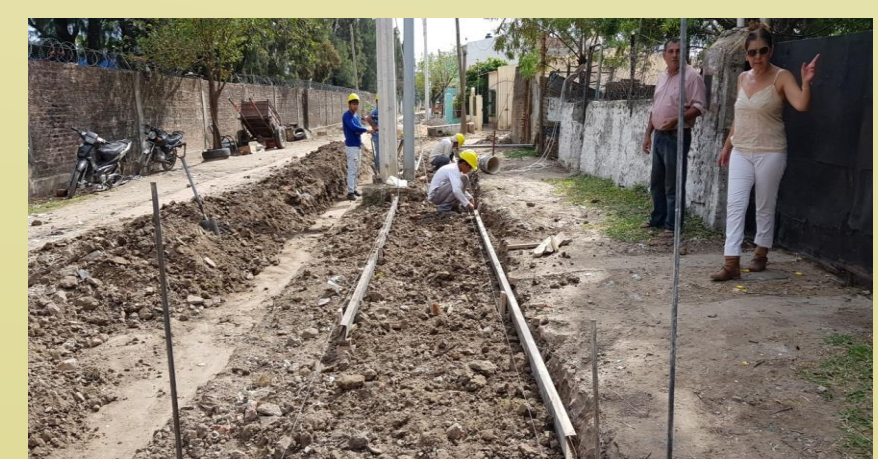
Imagen8- Trabajos de demarcación y preparación de terreno para la construcción de veredas y asfalto.