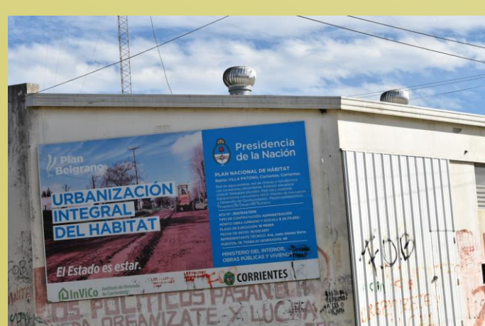
Imagen5- Foto Cartel de obra.

A partir de los datos elaborados y analizados se reafirma la necesidad de aumentar la inversión pública en programas y políticas habitacionales, focalizando las necesidades de la población, y ampliando las líneas de acción que contemplen soluciones habitacionales, ya sea a través de mejoramientos en las viviendas, extensión de redes de servicios, o construcción de viviendas para atender al creciente número de hogares.