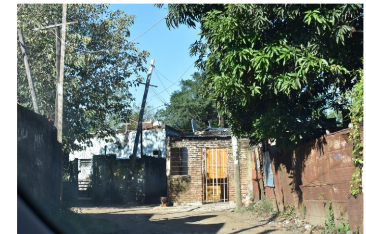
Imagen4- Foto del Estado inicial del sector de intervención.