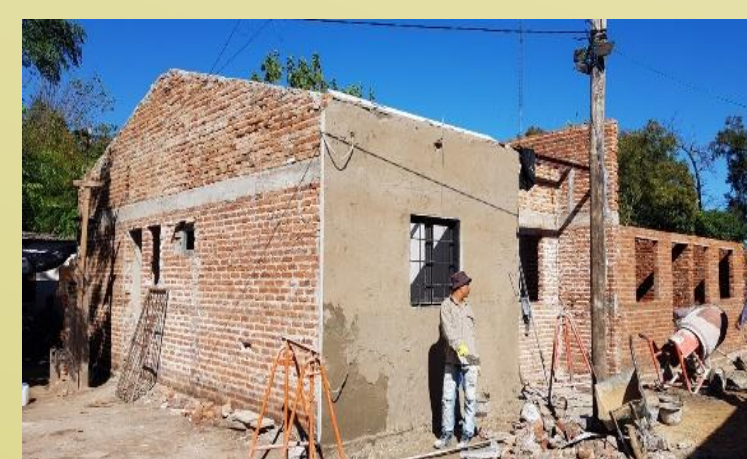
Imagen7- Foto de Mejoramiento de viviendas existentes en estado recuperable.